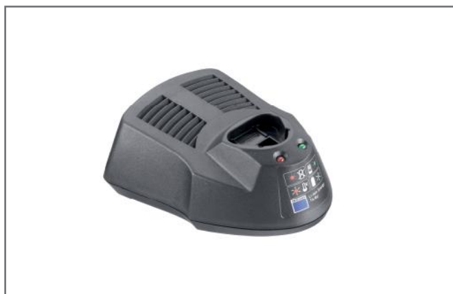
Hurtiglader (30 min.) Cli 10.8 V til Li-Ion batterier.