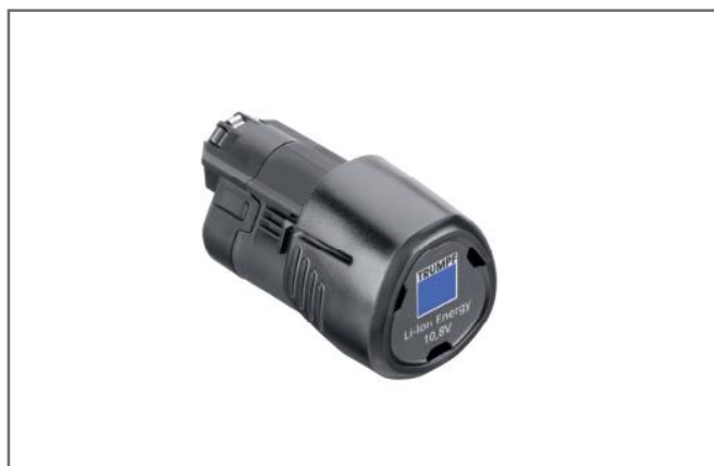
Li-Ion batteri. Langvarig og konstant akku teknologi.