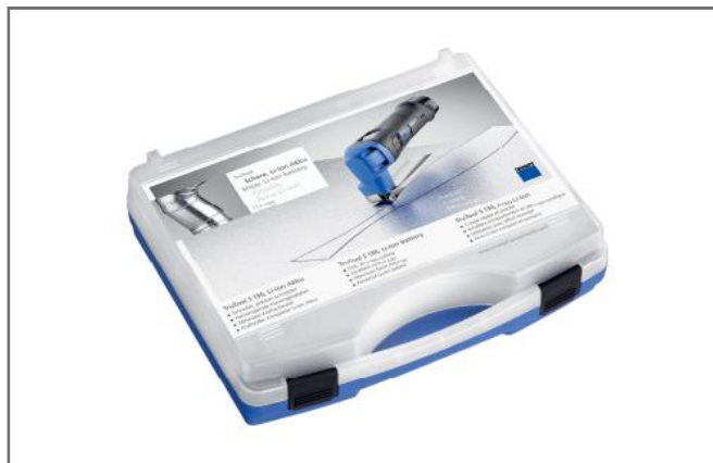
Maskinen leveres i kuffert