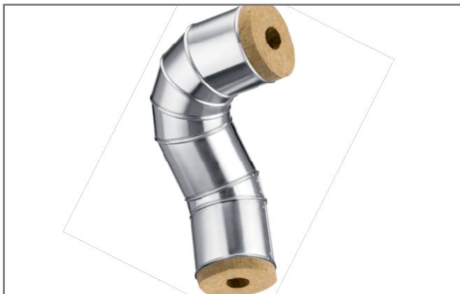
Teknisk isolering, en typisk opgave for S130-0A Li-Ion

Til bearbejdning af alle typer tyndplader af metal, især indenfor teknisk isolering, VVS, tag og væg samt ventilationsbranchen.