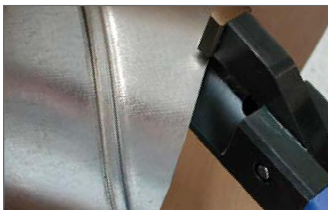
Start til kant

Til afkortning af rør, tæt til overflade af for eksempel vægge og lofter, især indenfor ventilationsbranchen