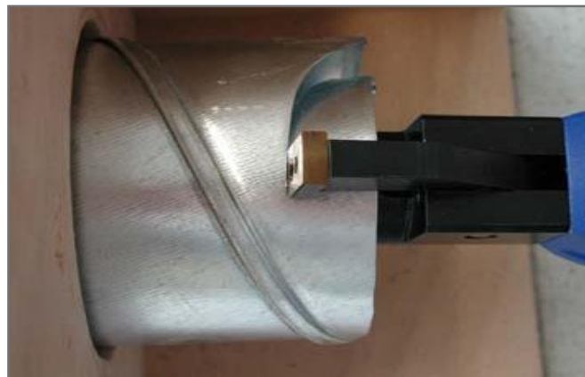
Afkortning af rør